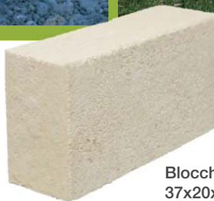
Blocchetto 37x20x11 cm circa 80 pezzi