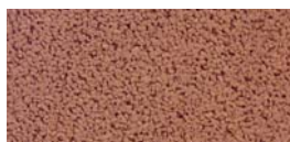
ARANCIO - Cod. 08