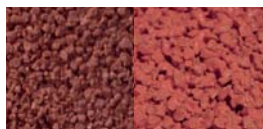
ROSSO - Cod. 03 / Cod. 12