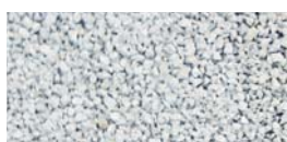
BIANCO - Cod. 02