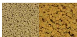
GIALLO - Cod. 05 / Cod. 11