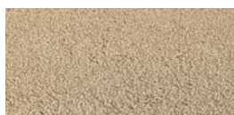
OCRA - Cod. 06