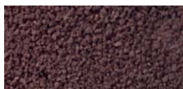
TABACCO - Cod. 07