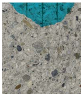
CLS ORDINARIO Profondità di penetrazione di 40 mm