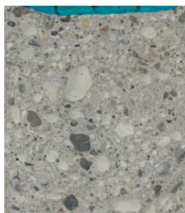
CLSRD WATERPROOF Profondità di penetrazione di 5 mm