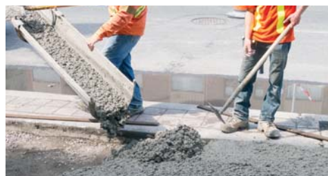
Indicato per la produzione di calcestruzzi utilizzati in opere di ingegneria civile e nella costruzione di strade.