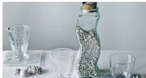
Idoneo per decorazioni interne.