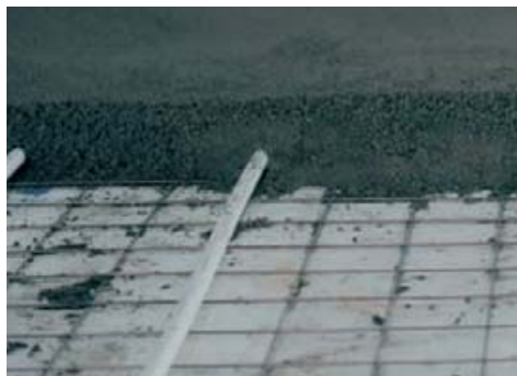
Utilizzabile per produzioni di massetti per pavimenti.

Materiale ottimo per: sottofondi spessore medio massetti per pavimenti e autobloccanti completamento di miscele cementizie