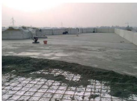
Idoneo per sottofondi.