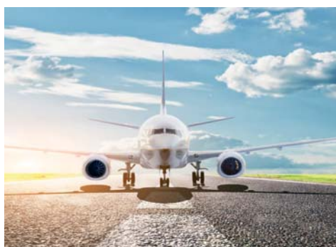
Idoneo per la preparazione di miscele bituminose e trattamenti superficiali per strade, aeroporti e altre aree soggette a traffico.