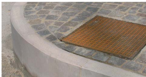
Ideale come sabbia di allettamento per cordoli.