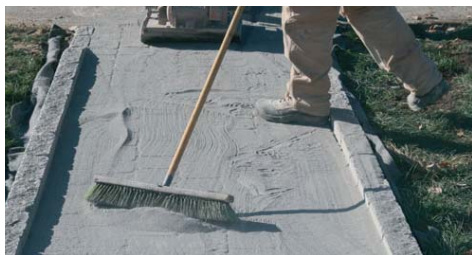
Idonea per la sigillatura masselli autobloccanti.