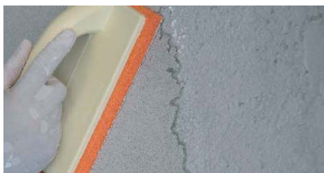
Come complemento per intonaci.