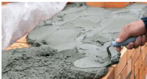
Indicato per la produzione di malte da muratura.