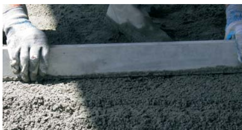
Idoneo per la formazione di massetti cementizi.