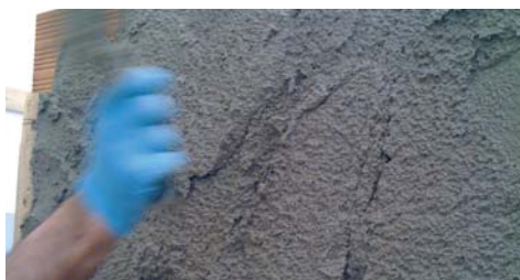
Ideale per la produzione di Intonaco.