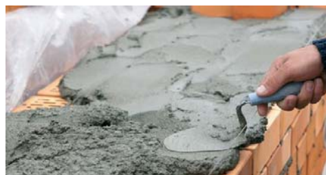
Indicato per la produzione di malte da muratura.