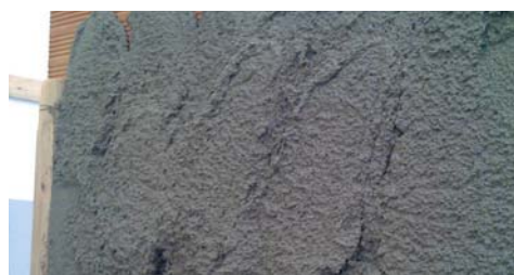
Ideale per la produzione di Intonaco.