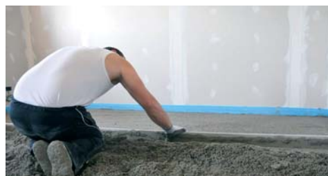
Idoneo per la formazione di massetti cementizi.