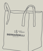
Big Bag 1 ton