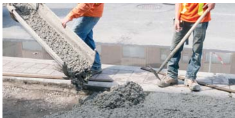
Indicato per la produzione di calcestruzzi utilizzati in opere di ingegneria civile e nella costruzione di strade.