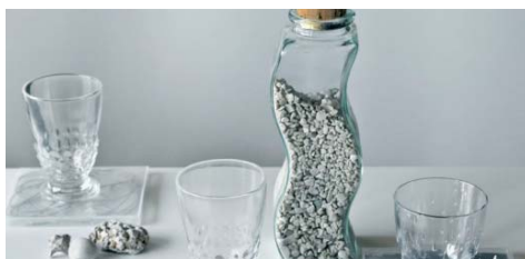
Idoneo per decorazioni interne.