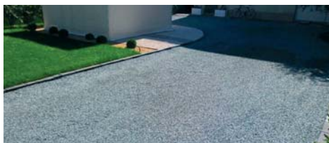
Utilizzabile per decorazioni esterne o per piccole opere drenanti.