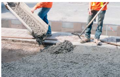
Indicato per la produzione di calcestruzzi utilizzati in opere di ingegneria civile e nella costruzione di strade.