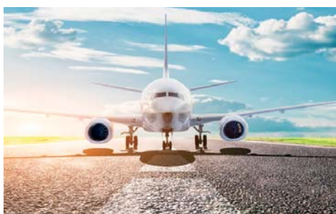
Idoneo per la preparazione di miscele bituminose e trattamenti superficiali per strade, aeroporti e altre aree soggette a traffico.