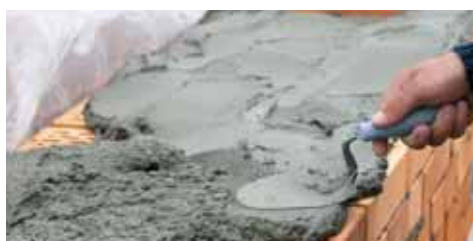
Indicato per la produzione di malte da muratura.