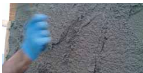
Ideale per la produzione di intonaco.