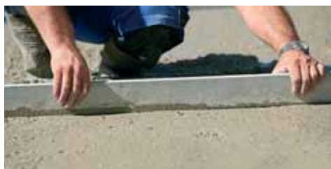
Idoneo per la formazione di massetti cementizi.