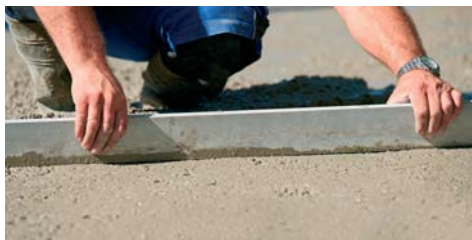
Idoneo per la formazione di massetti cementizi.