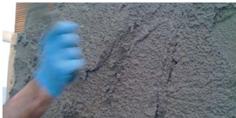
Ideale per la produzione di intonaco.