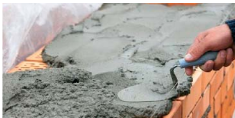
Indicato per la produzione di malte da muratura.