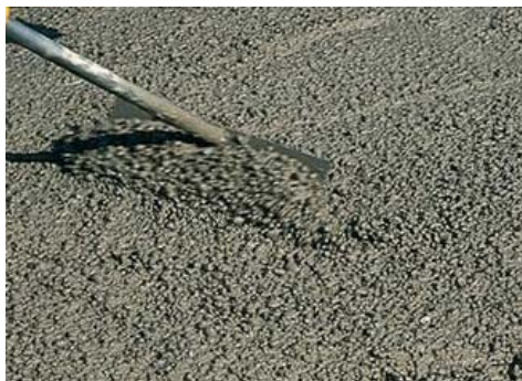
Formazione di calcestruzzi strutturali.