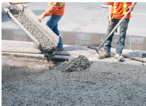
Indicato per la produzione di calcestruzzi utilizzati in opere di ingegneria civile e nella costruzione di strade.